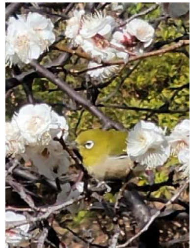
東京都大田区の池上梅園で