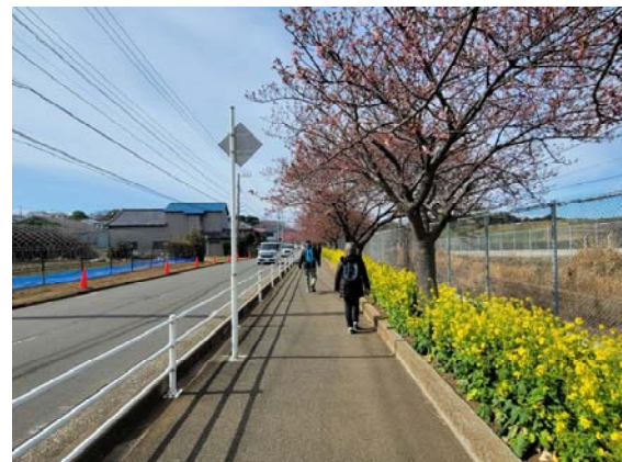
三浦海岸の河津桜（神奈川県三浦市）