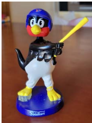
つば九郎のフィギュア