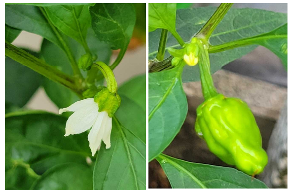
シシトウの花と実