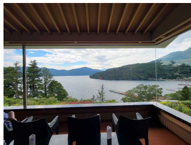
元箱根の成川美術館から