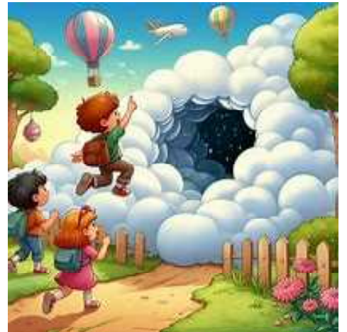
「雲の穴抜けていったよあの子たち」 AI (Copilot) が描いたイラスト