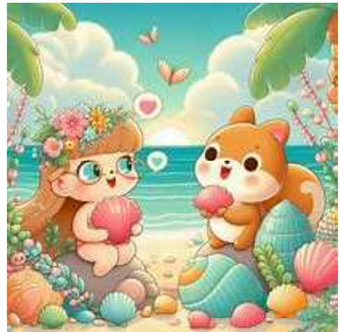
「砂浜で 貝殻話す 夏の恋」 AI (Copilot) が描いたイラスト