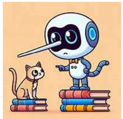
「AI は 賢くなっても 嘘つきだ」 AI (Copilot) が描いたイラスト