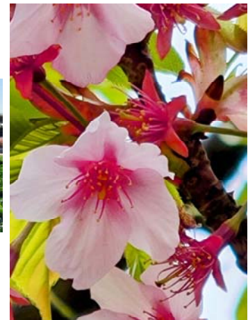
(左) (中央) 神奈川県・三浦海岸の河津桜、(右) 大田区・森ヶ崎緑華園の修善寺寒桜、そして今週はソメイヨシノがやっと開花しますね