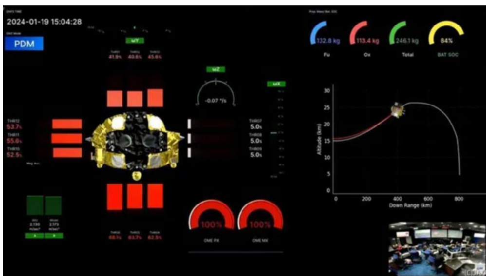
(上)月面探査機SLIM (下)ライブ配信された月面降下中のSLIMのテレメトリー画面。メインエンジンとスラスターの噴射状況、角速度の誤差、加速度、推進剤とバッテリーの残量など、多くのことがわかりやすくまとめられています。