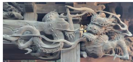
自性院牛頭天王堂(羽田)の軒下に施された彫刻