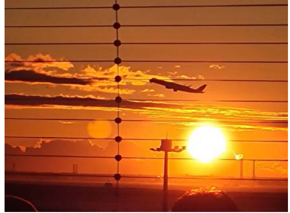
1月1日午前6時51分、羽田空港第2ターミナル展望台